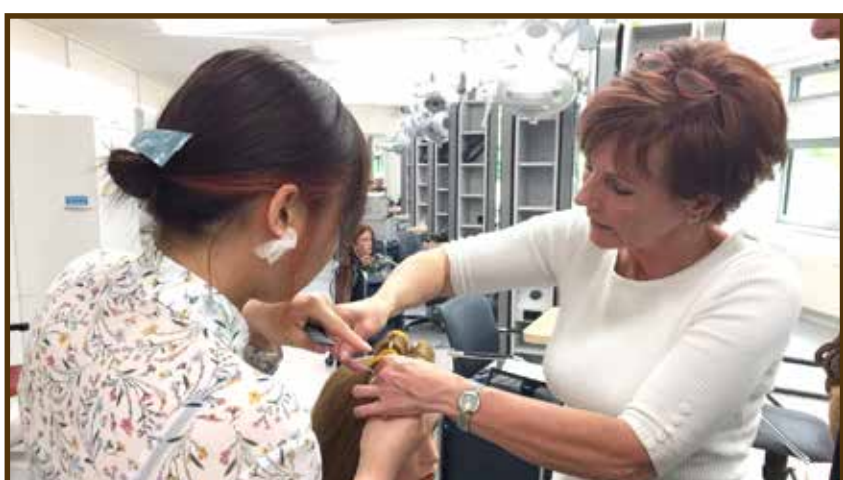
▲ヘアセットの授業で、ホットカーラーの巻き方を教わっています。