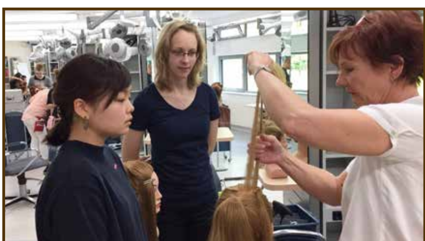
▲ドイツの結婚式でよく使われるヘアスタイルを教わっています。